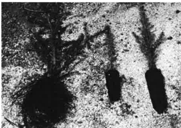
Plants à racines nues (gauche), plants en motte (droite)